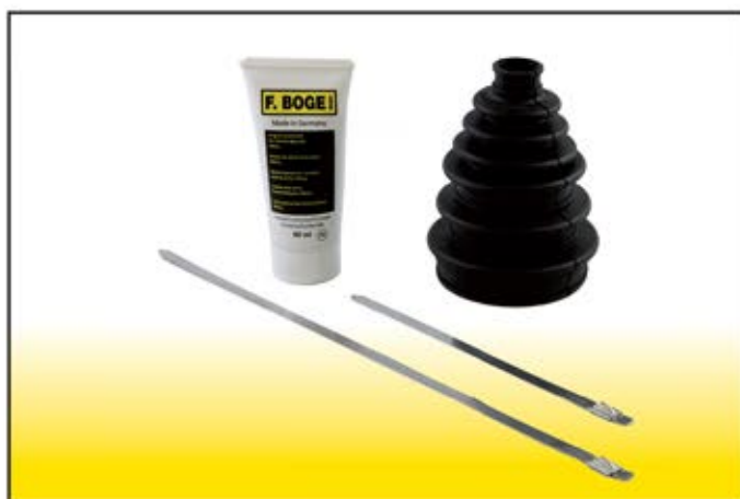
BOG 3052 kit cuffie autovettura universali