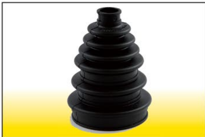
BOG 3051 cuffia universale N.V.E. „F.Boge“