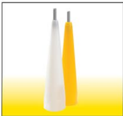
BOG 1005 Cono bianco per il montaggio cuffie universali fino a \phi 100