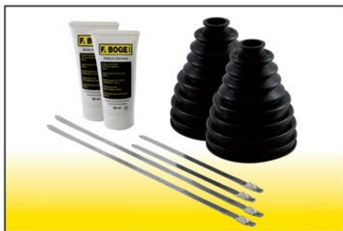
BOG 9002 Kit cuffie fuoristrada universali