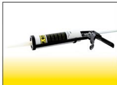
BOG 1009 Pistola erogatrice per cartucce grasso (cod. 3004)