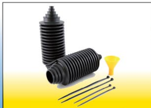
BGE 70051 kit cuffie iidroguida universali

TUTTE LE COMPOSIZIONI DEI KIT,, GLI ARTICOLI NON QUI PRESENTI E MOLTE ALTRE INFORMAZIONI SONO DISPONIBILI SU WWW.F-BOGE.IT