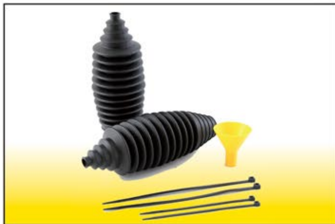
BGE 70050 Kit cuffie scatola sterzo universali