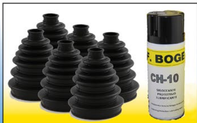
BOG 3070 Confezione comprendente: 6 cuffie universale N.V.E. „F.Boge“ 1 prodotto in omaggio