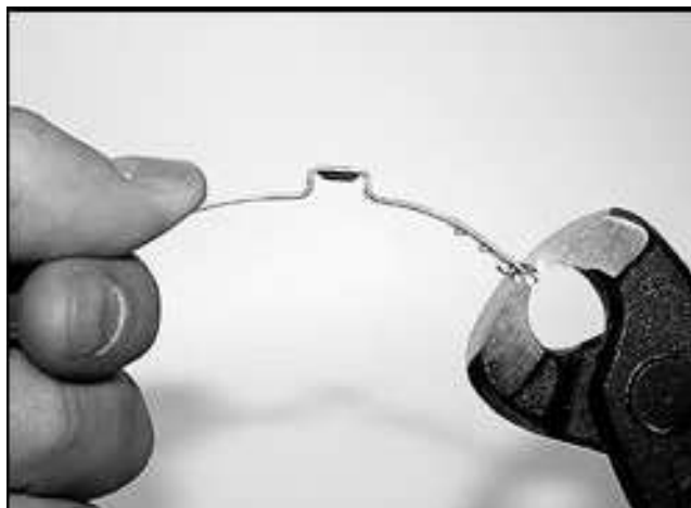
PRE- FORMARE LA FASCETTA