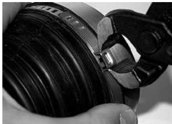
MONTARE LA FASCETTA, AGGANGIARLA E COMPLETARE IL FISSAGGIO STRINGENDO L'APPOSITO REGISTRO PREDISPOSTO